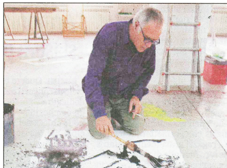
MIMMO PALADINO offrirà alla città di Ravenna uno spettacolo dantesco

A seguire, alle 22, in piazza San Francesco (in caso di maltempo all'in-